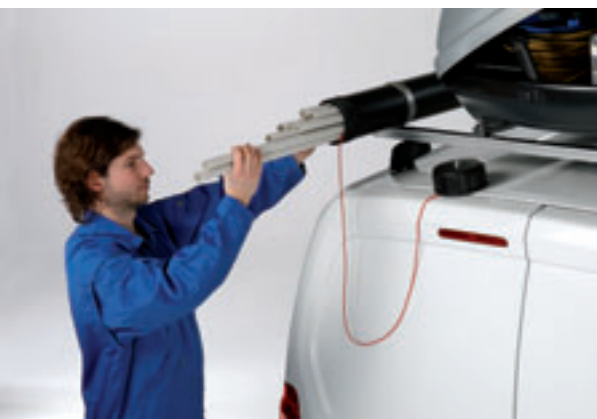
Rohre oder langes Ladegut sind im optionalen Laderohr sicher und trocken verstaut.

Im Laderohr kann langes Ladegut einfach und trocken transportiert werden. Durch die integrierte Rückholeinrichtung lassen sich auch kurze Rohrabschnitte wieder leicht entnehmen.