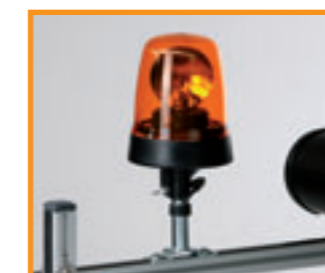
Rundumleuchte zur Gefahrsicherung Ihrer Einsatzstelle im Service oder kommunalen Bereich. Sie kann sowohl seitlich als auch oben am TopSystem befestigt werden. (Elektroanschluss vorausgesetzt)