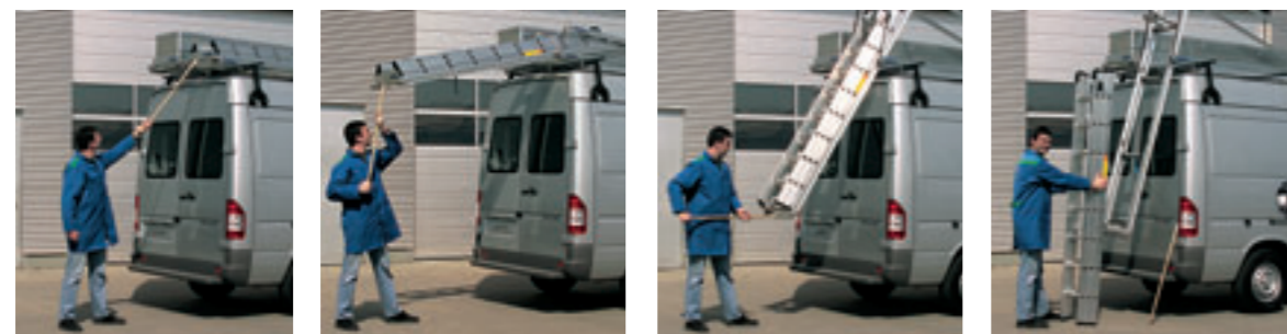
Der Sortimo Leiternlift erleichtert das Be- und Entladen von Leitern.

Der Sortimo Leiternlift ist natürlich mit dem neuen TopSystem kompatibel. Sperrige Leitern lassen sich so bequem und rücken-schonend be- und entladen.