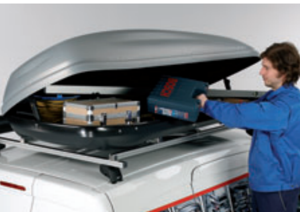
Dachbox mit 550 l Inhalt. Diese Dachbox lässt sich von beiden Seiten öffnen und kann so wahlweise auf der linken oder rechten Fahrzeugseite montiert werden.

Das Sortimo Dachträgersystem kann optional mit einer Dachbox ergänzt werden, da gerade bei kleinen Fahrzeugen die optimale Laderaumerweiterung eine große Rolle spielt. So lassen sich Gegenstände wie lange Wasserwaagen, Kabeltrommeln oder Werkzeugkoffer platzsparend und sicher in der Dachbox transportieren.