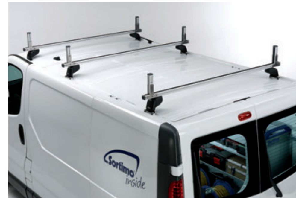
Basislösung mit sechs Füßen, drei Querträgern und sechs Profilstützen.

Natürlich ist die Basisvariante später jederzeit ausbaubar.